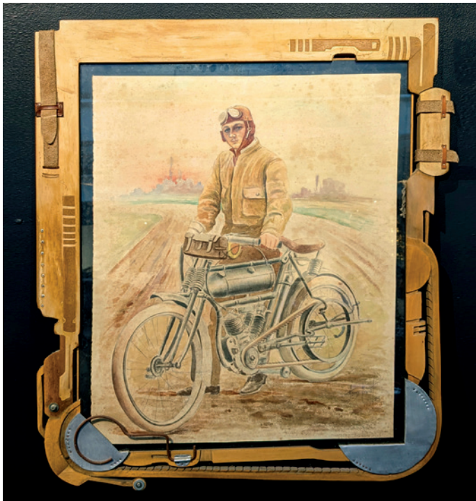
16 HAMEL Georges dit Géo HAM (1900-1972) : DEUX LITHOGRAPHIES polychromes et rehaussées, « Peloton de motards » et « Course de motards », sbd dans la planche, dans un cadre en bois et métal polychrome en forme de moto. Dim. des planches avec marges : 45 x 64,5 cm. Dim. du cadre : 65 x 155 cm. 300/400