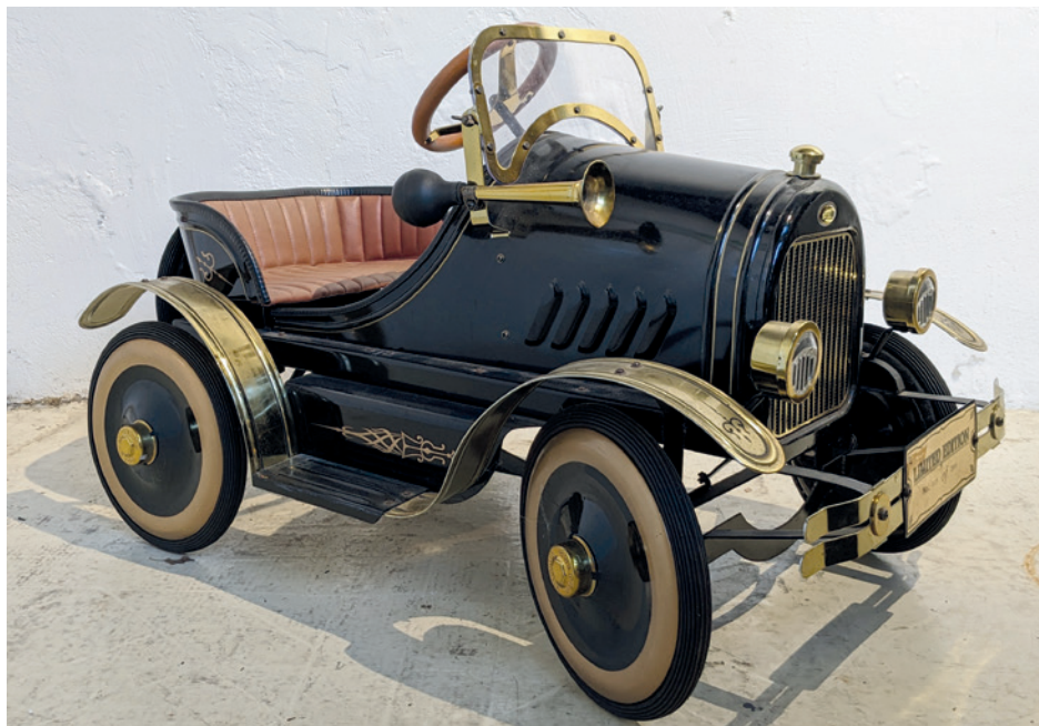
52 CLASSIC: VOITURE À PÉDALES modèle « Ford T », édition limitée années 1980 n° 38/2999, avec éclairage et klaxon (état proche du neuf, peu courante). 150/200