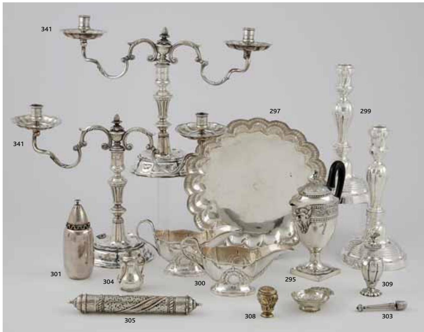
341 Candelabra à trois bras en métal argenté. 297 Grande assiette en métal argenté à bord festonné. 299 Vase en verre taillé. 301 Bouteille en métal argenté. 304 Petite fiole en verre. 300 Tasse en verre. 295 Tasse en verre. 309 Vase en verre taillé. 303 Petit objet en métal. 305 Objets en métal argenté. 308 Petite coupe en verre. 305 Petit objet en métal.