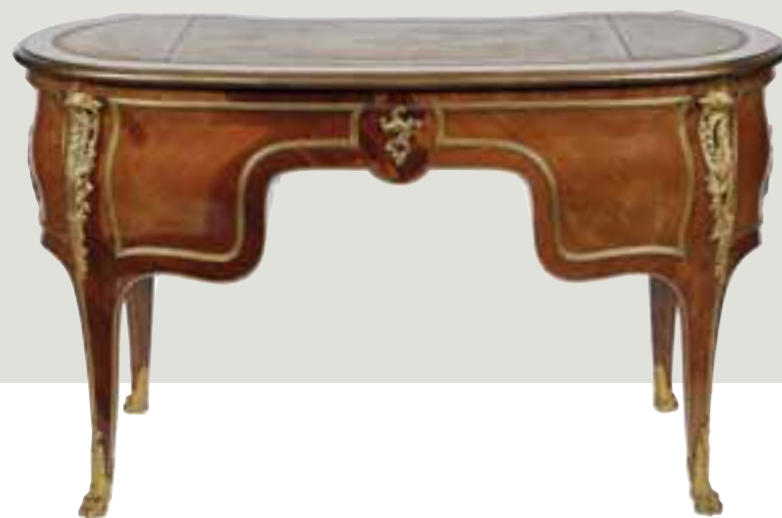
182 SEMAINIER en bois de placage à décor de frilage et de marqueterie géométrique. Agrémenté de bronzes ciselés, repose sur des plinthes et ouvre par sept tiroirs moulurés d'une frise de bronzes (quelques manques et accidents à la marqueterie). Epoque fin XIX e siècle. Haut. 157 cm. Long. 66 cm. Prof. 40 cm. 200/300