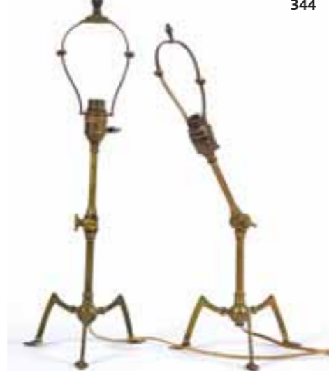
344 PAIRE DE LAMPES articulées en laiton, le piétement organique en forme de pattes d'insectes réuni par une sphère (un interrupteur changé, trous de fixation pour les mettre en applique murale). Vraisemblablement AUTRICHE fin XIX e siècle, dans le goût de Josef HOFFMANN. Haut. 51 cm. 150/200