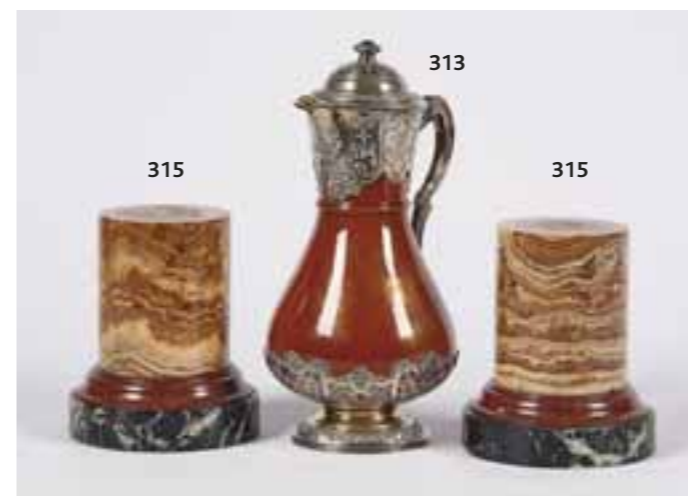
313 Paire d'obélisques en placage d'écaille et burgaut formant lampes (éléments du placage décollés) Vers 1970. Haut. 49 cm. 300/500