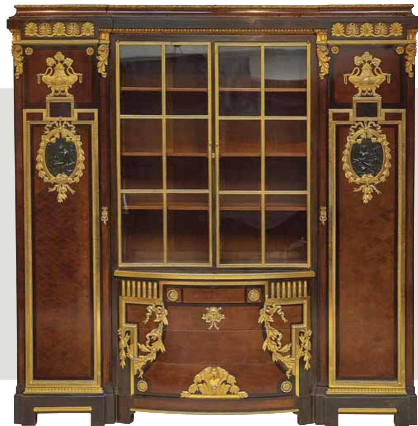
185* MERCIER FRERES : EXCEPTIONNELLE BIBLIOTHEQUE de style Louis XVI en placage d'acajou moiré, bois teinté et filets de bois clairs à riche ornementation de bronzes dorés ciselés à l'or brillant et mat. Repose sur des pieds quadrangulaires soulignés d'une moulure. Ouvre par deux portes latérales ornées de frises de feuilles d'eau et de pistils, filets d'oves et pirouettes. Au centre, deux médaillons en bronze à patine sombre représentant des faunesses et jeunes faunes dans des paysages encadrés de feuilles de laurier nouées. Le haut des portes latérales sommé d'un pot à feu à deux anses en forme de cygne et pieds en pattes de lion. Au centre dans la partie basse, une commode à ressaut sur quatre rangs richement décorée de

bronzes simulant des chutes de feuilles de laurier, rubans, feuilles d'acanthes, frises d'oves et pirouettes, feuilles d'eau et pistils. Les tiroirs agrémentés de cannelures dorées et pots de fleurs, les prises en forme de tourne-sols. Le corps central ouvrant par deux portes vitrées à baguettes de bronze doré et mat à réglettes. La corniche supérieure retenue par de larges feuilles d'acanthes présentant des frises de feuillages, feuilles d'acanthes, palmettes, oves et pirouettes (deux clefs). Marquée sur une plaque « MERCIER FRERES Faubourg Saint-Antoine à PARIS. De style Louis XVI, début du XX e siècle. Haut. 244 cm. Long. 234 cm. Prof. 50 cm. pour les portes latérales et 55 cm. pour la commode. 10000/15000