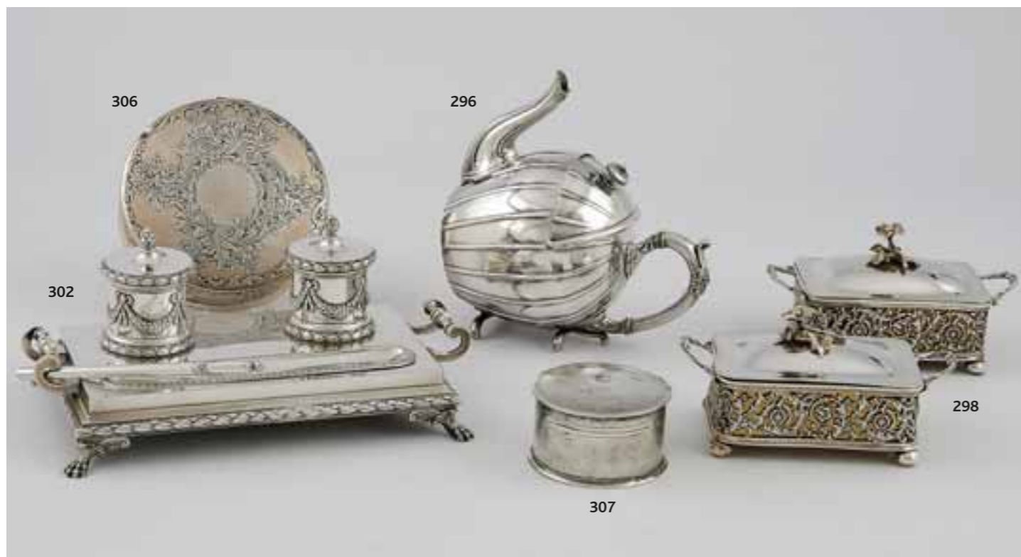
306 Grande assiette en métal argenté. 296 Tasse en verre. 302 Plateau en métal argenté. 298 Plateau en métal argenté. 307 Tasse en verre.