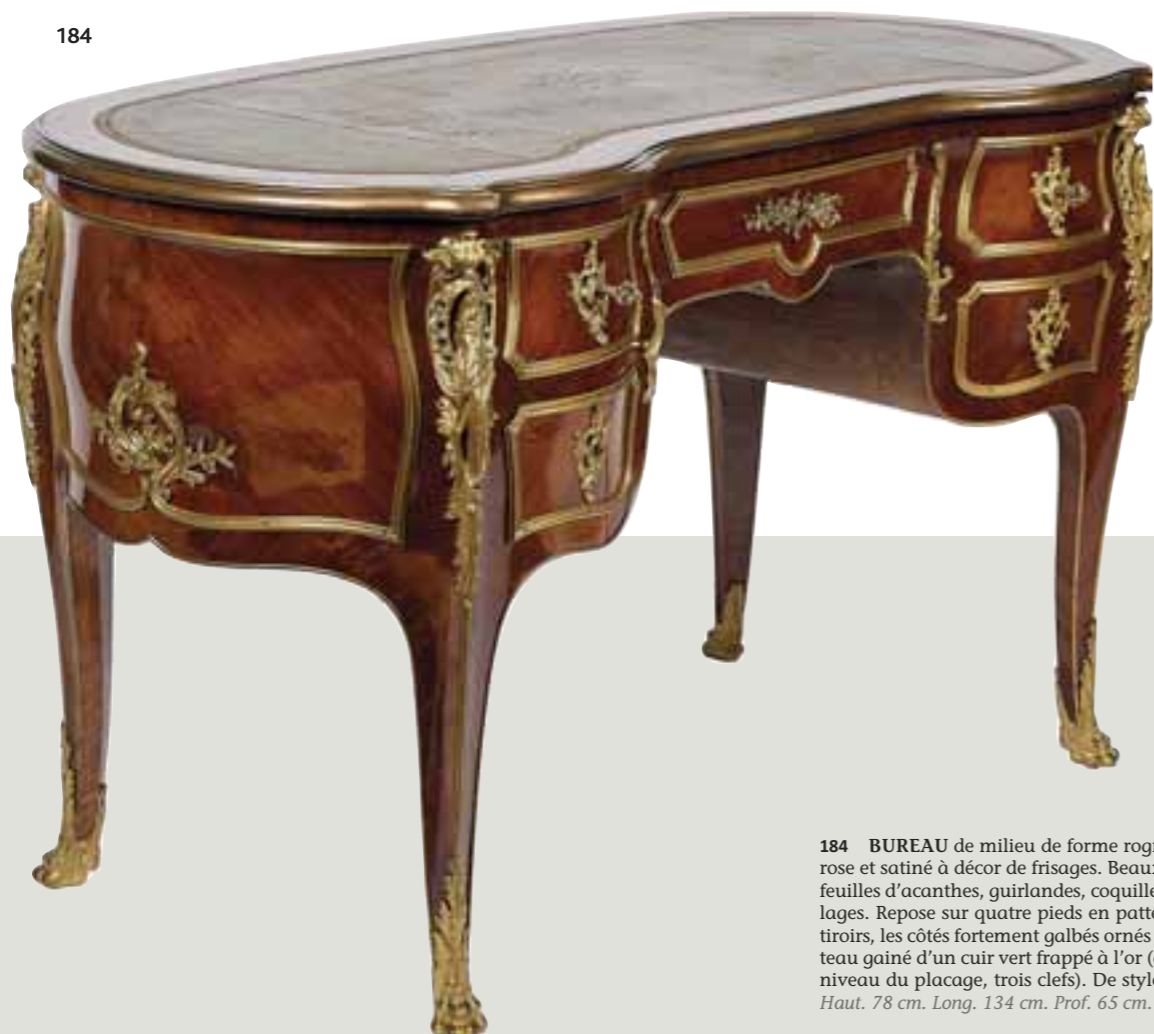
184 BUREAU de milieu de forme rognon en placage de bois de rose et satiné à décor de frisages. Beaux bronzes dorés à décor de feuilles d'acanthes, guirlandes, coquilles stylisées, vagues et feuillages. Repose sur quatre pieds en pattes de lion. Ouvre par cinq tiroirs, les côtés fortement galbés ornés d'un motif rocaille, le plateau gainé d'un cuir vert frappé à l'or (quelques décolorations au niveau du placage, trois clefs). De style Louis XV, fin XIX e siècle. Haut. 78 cm. Long. 134 cm. Prof. 65 cm. 2000/3000