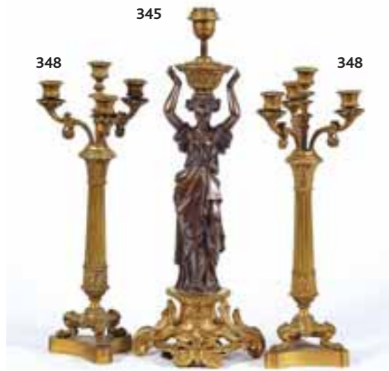
340 MEDAILLE en étain « Louis Stanislas Xavier de France Comte de Provence », au centre un guerrier à cheval tenant glaive et bouclier (trou de suspension). Epoque XVIII e siècle. Diam. 11 cm. 30/40