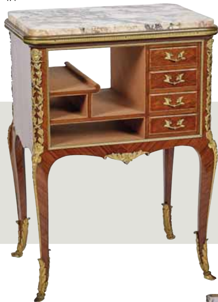
171 François LINKE (1855-1946): MEUBLE de présentation de milieu en placage de satiné à décor de frisage et de motifs géométriques, beaux bronzes dorés et ciselés à décor de feuilles d'acanthes, feuilles de laurier et têtes de Bacchus enfant. Repose sur quatre pieds galbés à terminaisons ongluées, la ceinture chantournée agrémentée de fruits. Ouvre par quatre tiroirs et présente quatre étagères mouvementées, le dessus en marbre brèche. Les bronzes signés sous les pieds « L. F » pour LINKE François. De style Louis XV, fin XIX e siècle. Haut. 82 cm. Long. 60 cm. Prof. 40 cm. 1200/1500