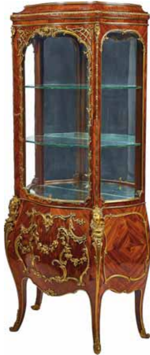
168 François LINKE (1855-1946) : TRES BELLE VITRINE en placage de satiné et de bois de rose à riche ornementation de bronzes dorés. Repose sur quatre pieds fortement galbés se terminant par des enroulements et de larges feuilles d'acanthes. Les montants sommés de bustes féminins à aigrette, entourés de motifs rocailles et coquilles. Les côtés et la façade vitrés. Ouvre par une porte soulignée de guirlandes de fleurs, rinceaux feuillagés, coquilles stylisées et vaguelettes. La corniche agrémentée de coquilles, entrelacs et frise d'oves et feuilles d'acanthes, signée « F. LINKE », porte une étiquette ancienne au dos « 1810 vitrine Louis XV numéro 219 » (deux étagères en verre, une clef pour la partie vitrée, les serrures du bas bloquées). De style Louis XV, fin XIX e siècle. Haut. 170 cm. Long. 72 cm. Prof. 38 cm. 5 000/6 000