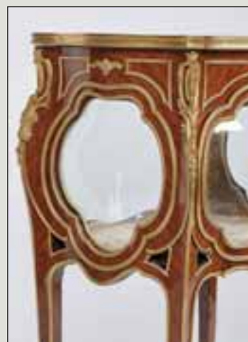
172 François LINKE (1855-1946), dans le goût de: BELLE VITRINE toutes faces en placage de bois satiné à décor de frisage. Richement ornée de bronzes dorés décorés de feuilles d'acanthes, rosettes, chutes, moulures et enroulements. Repose sur quatre pieds galbés supportant un corps à cage à vitres bombées de forme polylobée. Ouvre par une porte et un plateau à charnières à vitre biseautée (quelques infimes manques de placage à l'arrière des pieds, le mécanisme d'ouverture bloqué, sans les clés). De style Louis XV, fin XIX e siècle. Haut. 83 cm. Larg. 46 cm. Long. 65 cm. 2500/4000